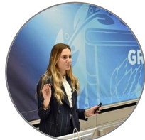
ANGELICA IMPRONTA MAG